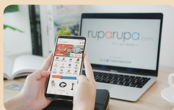
Kemudahan memesan berbagai produk melalui aplikasi seluler dan website Ruparupa.com.

ribu dan Rp500 ribu. "Ruparupa.com telah melayani lebih dari 500 ribu pelanggan di seluruh Indonesia sejak pertama kali diluncurkan. Ke depan, kami ingin melayani lebih banyak lagi masyarakat Indonesia dan terus meningkatkan layanan sesuai dengan visi Ruparupa.com yaitu menciptakan hunian sebagai tempat yang hangat untuk keluarga, tempat kerja yang mendukung produktivitas, dan meningkatkan kualitas hidup," tandas Teresa. • vit