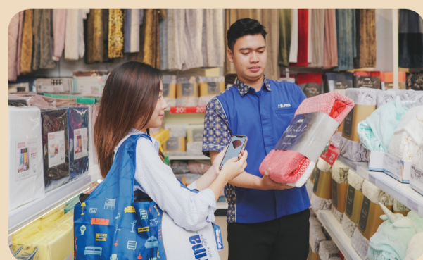
Dengan scan produk, pilih jenis pengiriman, lakukan pembayaran, tidak perlu antri di kasir.